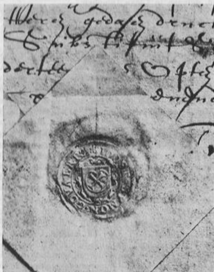
Schepenzegel van Joost Symon Goderts 1639

JOOST SYMON GODERTS werd in 1637 op de voordracht geplaatst voor de benoeming tot schepen van Dongen, met de aanbeveling „wesende den swaeger van PEETER SIJMONS" (VAN SON) en werd benoemd (10) . Zijn schepenzegel is gedrukt op een schepenacte van Dongen dd. 14 Mei 1639 (11) . Met het zelfde wapen zegelde zijn vader SYMON GODERT SYMONS als schepen van Dongen 6 September 1612 (12) .